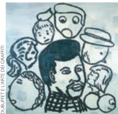
DUBUFFET L'ARTE DEI GRAFFITI